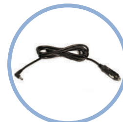
Inogen One G5 Câble d'alimentation CC* Réf. article BA-306