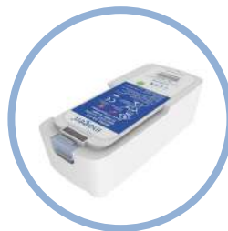
Inogen One ® G5 Batterie ion-lithium longue durée** Jusqu'à 13 h d'autonomie Réf. article BA-516