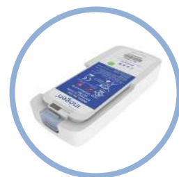
Inogen One G5 Batterie ion-lithium* Jusqu'à 6,5 h d'autonomie Réf. article BA-500