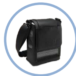
Inogen One G5 Sacoche de transport* Réf. article CA-500