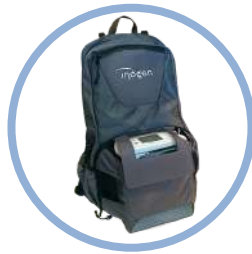
Inogen One G5 Sac à dos** Réf. article CA-550